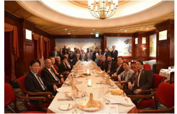
2019 SAME Joint Meeting