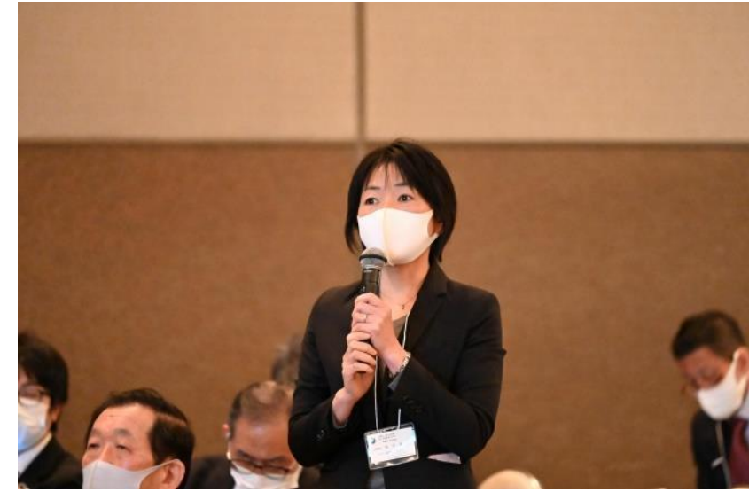
Research Symposium Presentation of academic research related to defense facility engineering Apr. 19, 2021 Event: approximately 600 attendees.