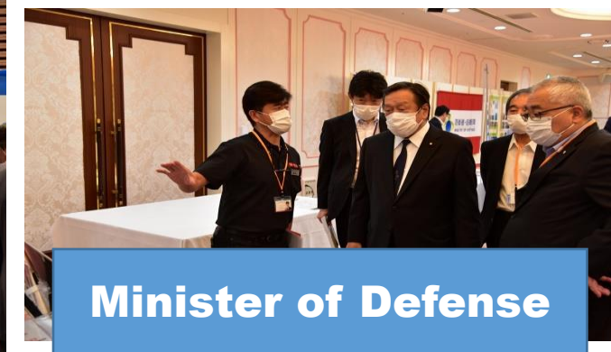
Minister of Defense