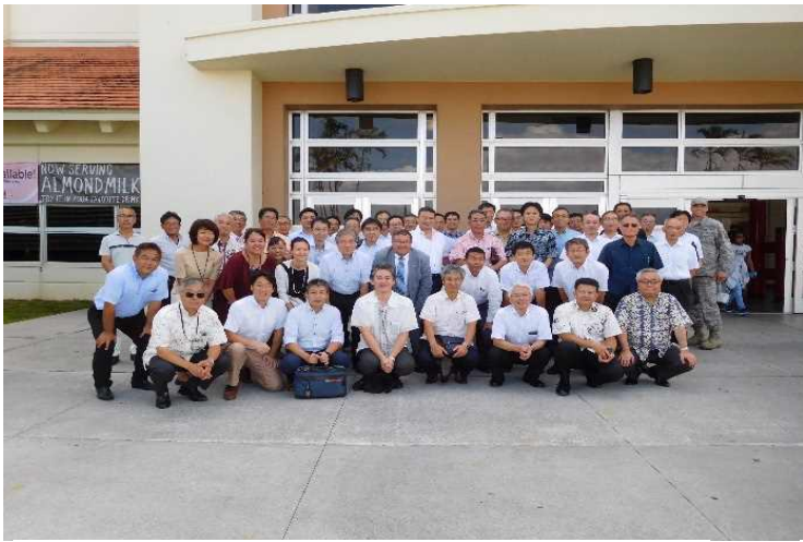
2017 JSDFE in Kadena