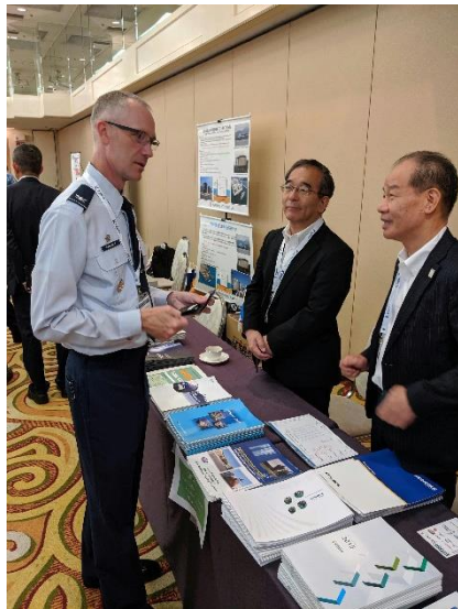
2020 SAME Japan Okinawa Symposium