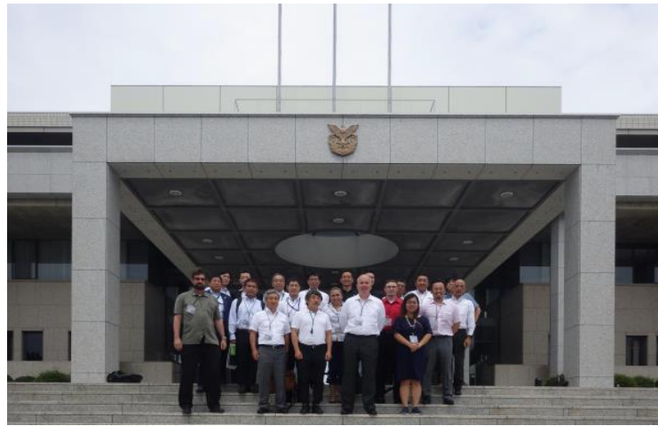
2018 SAME Japan at the National Defense Academy