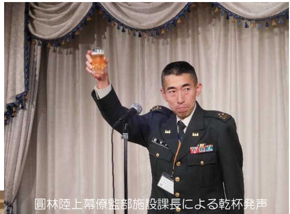
圓林陸上幕僚監部施設課長による乾杯発声