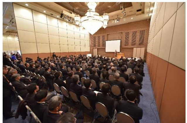
西防衛大臣政策参与の講演