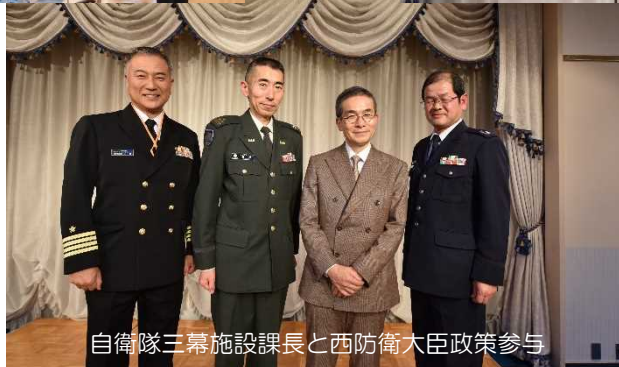
自衛隊三幕施設課長と西防衛大臣政策参与